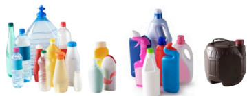
Bidons, flacons et bouteilles en plastiques