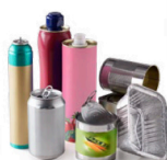
Barquettes, conserves, aérosols, canettes