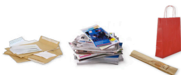
Tous les papiers